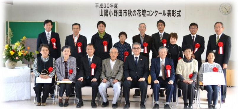
(厚陽小中学校が「優秀賞」を受賞しました！！)

学校支援をはじめ、各種活動にご協力いただける方を募集しています。できる時にできる範囲で構いません。お気軽に事務局までご相談ください♪