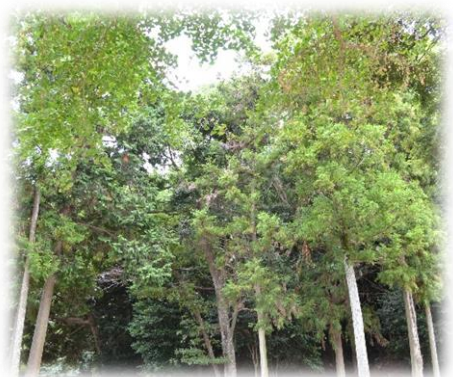
（吉部田八幡宮 県指定樹林）