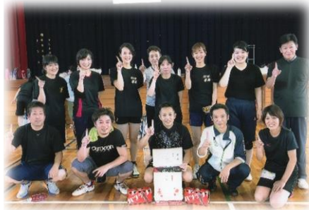
(市P)親睦球技大会の厚陽チームソフトバレーで1位でした！

最近、国が提唱している“働き方改革”ってご存知でしょうか。耳にしたことがあるという人は多いかもしれませんね。「残業を減らすんでしょ？」と思っている方、もちろん正解です。働き方改革は、50年後も人口1億人を維持し、誰もが活躍できる社会（一億総活躍社会）の実現に向けた取り組みです。人口減少に伴い、労働力人口（生産年齢人口）の減少が予測される中で、1. 働き手の増加、2. 出生率の上昇、3. 労働生産性の向上 を掲げています。その具体策として、長時間労働の解消や非正規雇用の格差改善、高齢者の就労促進などが挙げられています。誰もが自分らしい生き方をするために、社会全体で考え、取り組むべき大切な問題ですね。