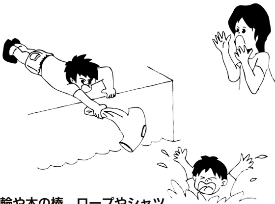
浮き輪や木の棒、ロープやシャツ などを差し出して、つかまらせる。