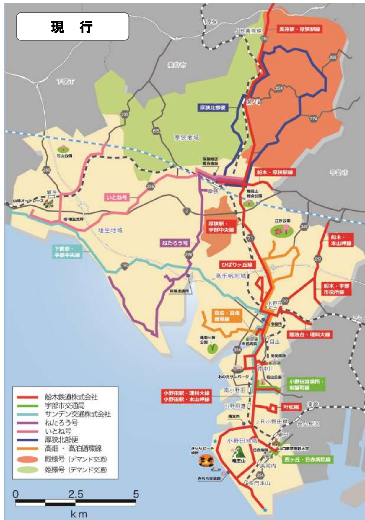
○現行のバス路線と再編後のバス路線