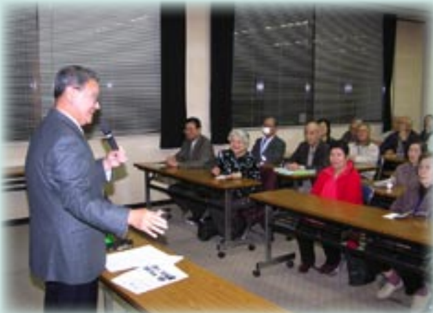
▲「市政説明会」のようす

新しい山陽小野田市に、今まで以上の誇りと愛着を持てるよう、市民のみなさんと一体となり、住み良いまちづくりの推進に向け努力して参りますので、今後とも、みなさんのご支援とご協力をお願い申し上げます。