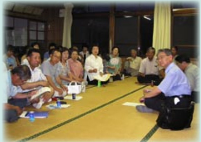
▲「対話の日」のようす