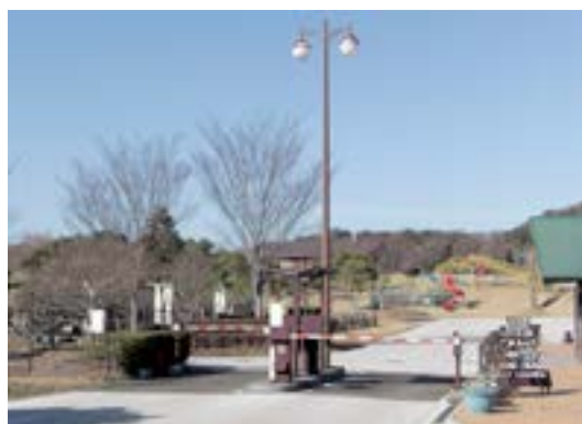
←オートキャンプ場

A 企画段階ではなかったが、ヒアリングの時に考えていく旨の話があった。 結果 全員賛成