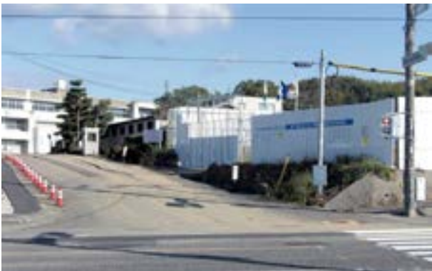
埴生地区複合施設整備工事状況

答 歴史民俗資料館の保管庫のスペースがいっぱいのため、保管できない歴史資料を青年の家などに分散して保管している。青年の家は管理棟などの老朽化が著しいため、平成32年度以降解体する方針であり、解体するまでに別の保管場所を確保し、新しい収蔵庫の建設等も含めて検討する。