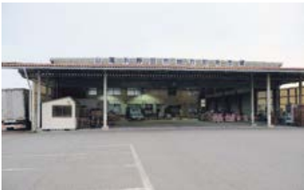
山陽小野田市地方卸売市場