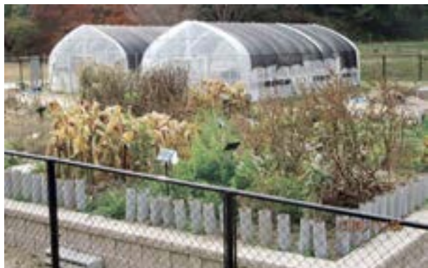
江汐公園内の薬用植物園

答 整備を始めるに当たり、大学と協議をする中で、給水タンクを設けず、第2駐車場の給水施設を利用することで、散水に支障がないとのことから、現在の整備を行った。現在は、指定管理者が水やりを行っている。