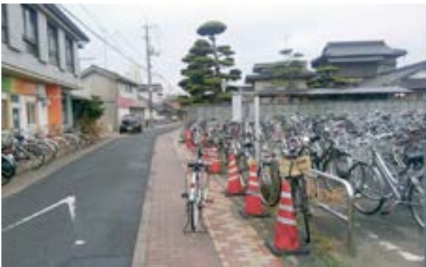
自転車でいっぱい的小野田駅前

答 各駐輪場を年2回調査し、調査札を2週間置いたのち放置自転車として撤去移動しているが今年度は131台あった。その後、遺失物として届けて引取りがなかった場合、リサイクル業者に1台10円で買い取ってもらっている。過去にはレンタルサイクルで活用したこともあるが現在は処分している。