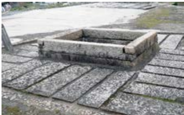
現存する木戸地区の共同井戸

答 当面は、水道事業の広域化や内部努力を積極的に行うことを考えており、最後までさまざまな努力をする。そして市民の皆様には水道料金の値上げをお願いするのは、最後の手段と考えている。