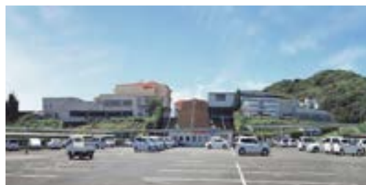
正面外観イメージ

委員会では全員賛成となりましたが、本会議では改修計画に対する返済計画などで異論が出され、採決の結果賛成多数で可決しました。