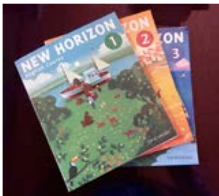
英語教育の教科化

答 派遣事業参加生徒のアンケート調査などから、中学生の時期に海外生活を経験することは、さまざまな点で大きな意義があることが確認された。今年度から 2 名増やし、今後も本事業の効果を広げていきたい。昨年のもートンベイ市長の訪問から交流が進み、2020 年に予定されている大学開学に藤田市長が招待を受けている。