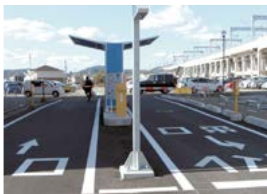
←新しくなった出入口

A 現在のところ、ライン枠は考えていないが、状況を見て未舗装部分を検討していく。 結果 全員賛成