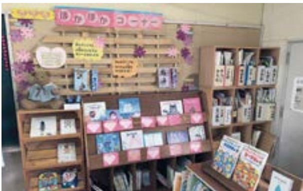
学校図書室の調べ学習コーナー