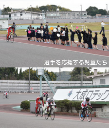
選手を応援する児童たち