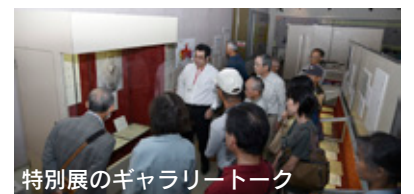
特別展のギャラリートーク

明治改元から150年を迎える今年には国内・県内で明治維新に関連する様々な催しが行われた。本市でも歴史民俗資料館で特別展などの明治維新関連事業に取り組んだ。