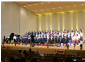
▲出演者全員で合唱