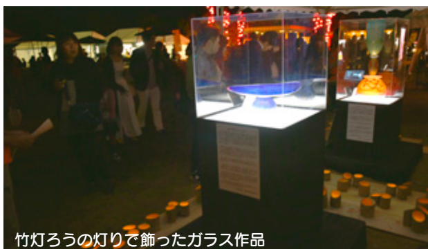
竹灯ろうの灯りで飾ったガラス作品