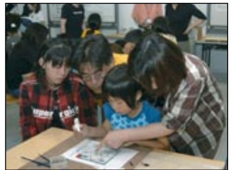
▲来年の国民文化祭にあわせ、8月に「ふれあいガラスフェスタ」を開催