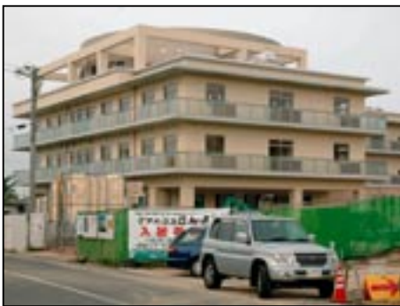
▲PFIにより建設される「ケアハウスさんよう」（10月1日オープン予定）

江戸時代から昭和初期の灯火具等を一堂に展示し、灯りの歴史を紹介します。歴史民俗資料館において11月開催予定です。