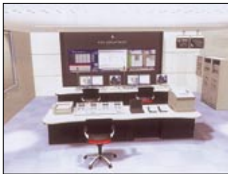
▲合併により拡大した市域の消防・救急体制を支える高機能消防司令施設（完成イメージ図）