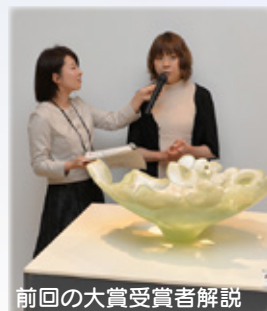
前回の大会受賞者解説