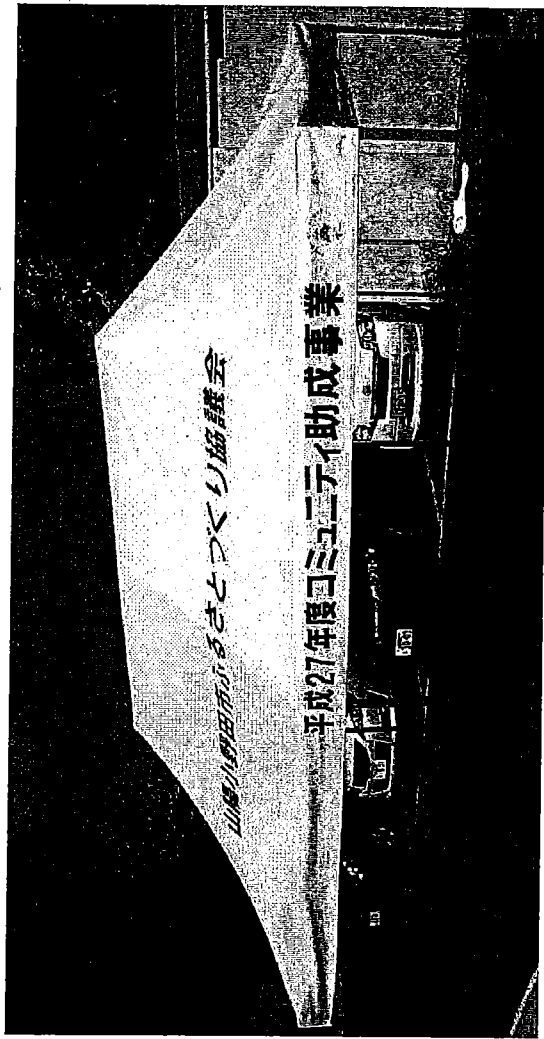
ワンタッチテント