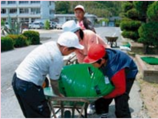
▲力を合わせて、重い肥料を一輪車から下ろします。