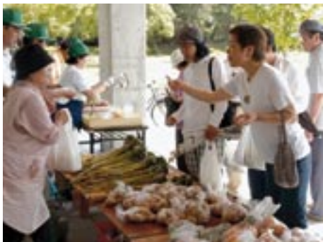
▲新鮮な野菜が並ぶ朝市