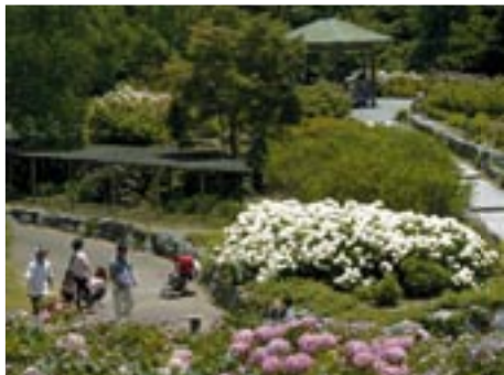
▲▼江汐公園内にある「あじさい園」