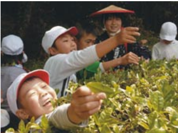
▲自分より背丈の高い茶の木から若葉を摘み取ろうとする児童。