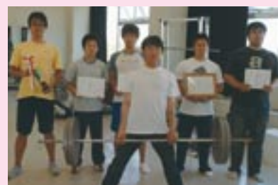
▲全国大会での活躍が期待される パワーリフティング部のみなさん。