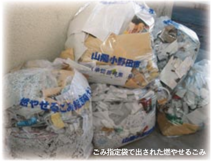
ごみ指定袋で出された燃やせるごみ