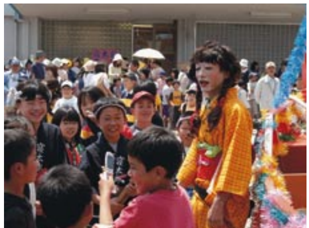
▲子どもたちに囲まれて写真を撮られる「寝んね子さん」。