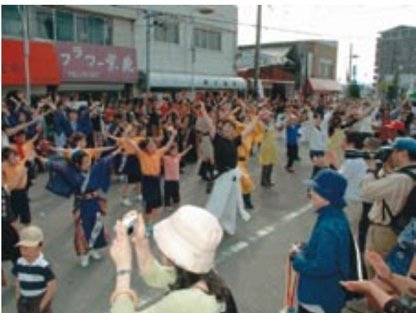
▲飛び入り参加も大歓迎の「よさこい」総踊り。

5月8日、有帆公民館周辺で「有帆市まつり」が行われました。これは、江戸時代から続く伝統のまつりで、農機具市がはじまりと言われていいます。昔ながらの野菜苗や竹製品などを売る店がある中、地域の団体や地元店の出店などもあり、たくさんの人でぎわいました。