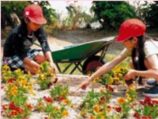
▲パンジー、ノースポールなど、春の花を植え替えていきます。