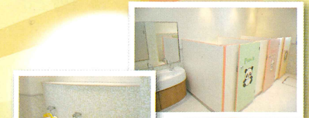
幼児用トイレ お子さんが使いやすい幼児用のトイレです。