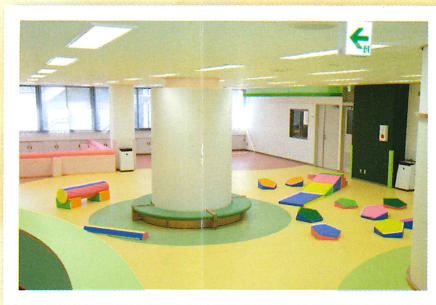
プレイスペース 親子でくつろぎ、子育て世代が交流できるスペースです。