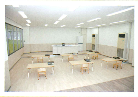
キッズキッチン 未就学児の親子を対象に食に関する講座を行います。