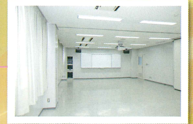
多目的室 幼児健診、育児学級、子育てサークル活動などを行います。