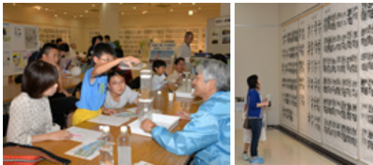
昨年の水道展の様子(左:水道教室, 右:展示)