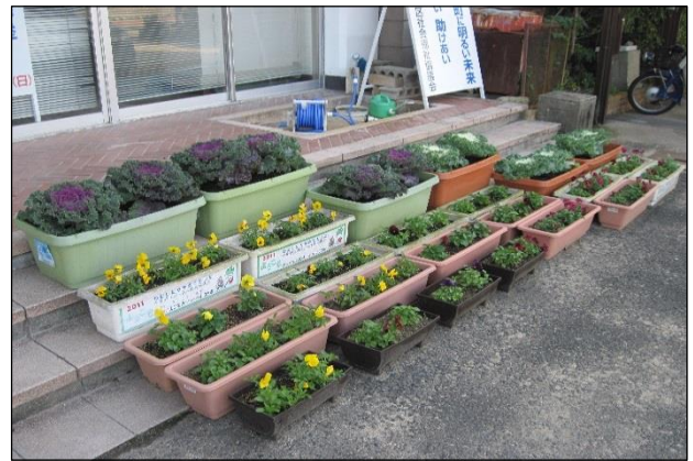
(公民館玄関前 26.12.9 現在)