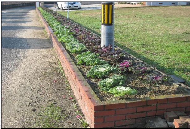
(公民館進入路横花壇 26.12.9 現在)

さて厚陽公民館では、11/12(水)『中学生職場体験』によるプランターへの苗植え、また『緑と花の推進協議会』様には公民館進入路花壇へ葉牡丹の定植作業を行っていただきました。花壇の雰囲気も冬の花に植え替えたことにより、だいぶ変わりましたので、皆様ご見学に来ていただければと思います♪