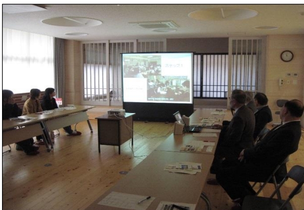
（油谷公民館長より講義の様子）

ラポールゆやの施設見学後、隣接する油谷小学校で公民館長より講習を受け、児童が琴を学んでいるところを見学してきました。