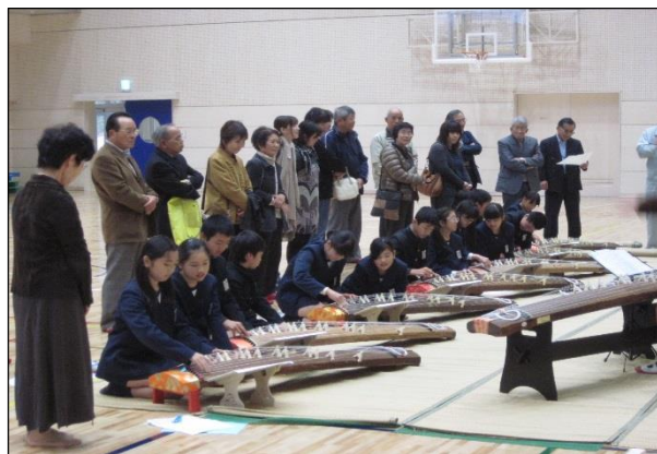
（児童が琴を習っている様子）

高齢化率46.9%の長門市油谷地区での課題や、公民館が生涯学習の拠点のみならず地域作りの拠点として活動していること、また公民館で琴のクラブを行っている方達が、小学校で児童たちと一緒に活動するところを見学するなど収穫の多い視察研修になりました。