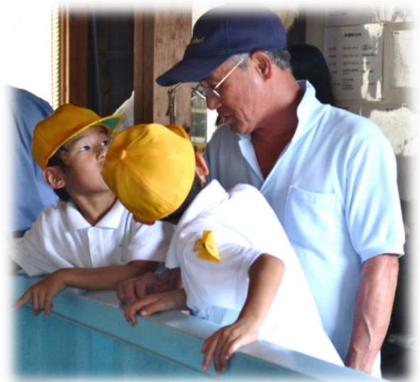
(原田先生が分かりやすく説明してくれます)

たくさんの「人との関わり」や「体験」を通じて、「厚陽」という地域の良さを感じて欲しいですね。