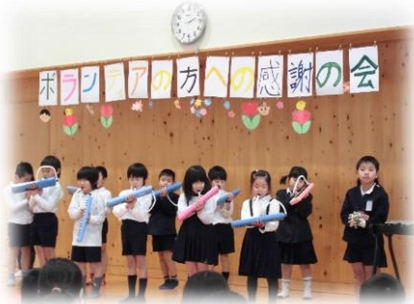
(今年の”感謝の会”より)