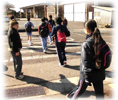
(昨年の”立志のつどい“より)

また、一緒に歩いてみたいという方も数名いらっしゃいます。現在、配車等について調整中ですので、申込者には改めてご連絡させていただきます。(今回に限り、保険の対象となっています。)