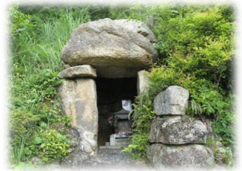
（有帆）仁保の上古墳