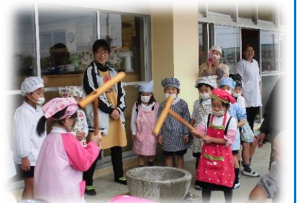
（H27）ふれあいもちつき

学校支援をはじめ、各種活動にご協力いただける方も募集しています。 できる時にできる範囲で構いません。お気軽に事務局までご相談ください♪