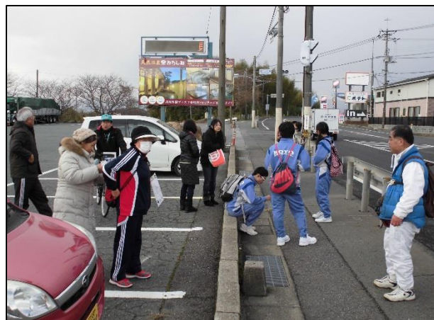
【昨年度のロングウォークの様子(植生みちしおにて)】

また、昨年参加された地域の方は『子ども達自身の決意をあのようすばらしい場所で聞くことができ、とても有意義な時間を過ごすことができました。』とおっしゃられていました。子ども達の将来の夢や希望を一緒に聞きに行きませんか??