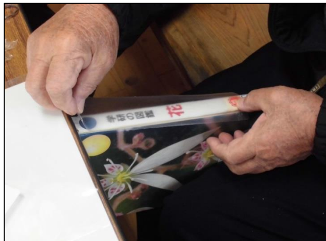
【みなさん上手に修理をされていましたよ♪】

本を修理することにより、子ども達も物を大切に作る心が芽生えてくれるとうれしいですね！また、それを見たボランティアさん達のやりがいにつながってほしいと願っています。