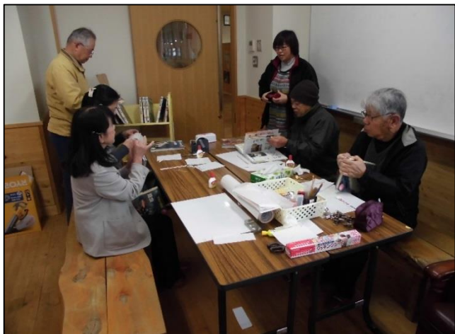
【最初に森重先生のお話を聞きました】

最初は、みなさん会話が弾んでいたのですが、細かな作業になりますので、みなさん慎重に作業されておられ、後半は静かに黙々と修理作業をおこなっていました♪