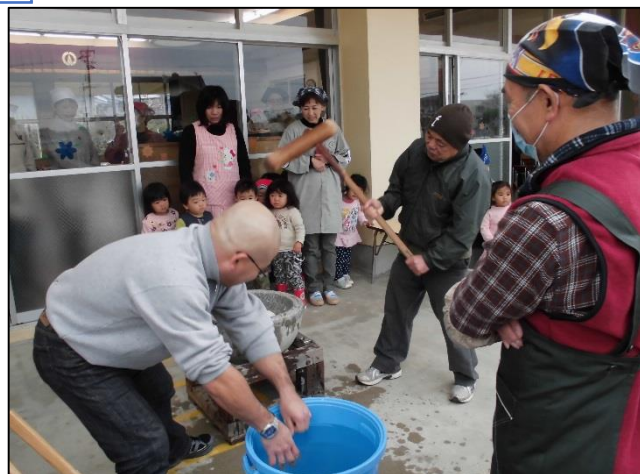
【保護者・祖父母・地域の方々による餅つきの様子】

とってもかわいい子ども達と交流ができますので来年もこの『ふれあいもちつき会』に地域の皆さまも一緒に参加しませんか？