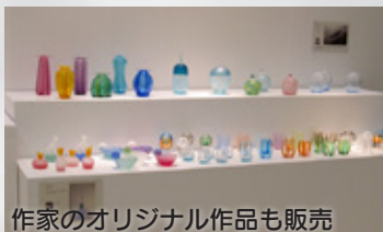
作家のオリジナル作品も販売