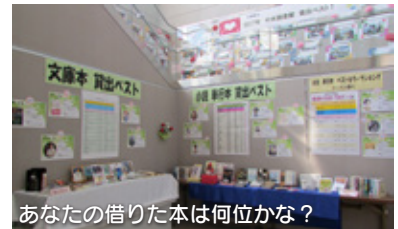
あなたの借りた本は何位かな?