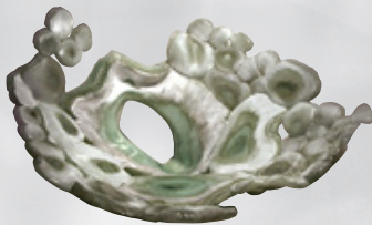
前回の大賞作品「溜まる場所」