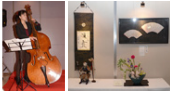
▲昨年の「アートのためばこ」