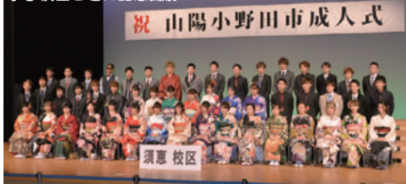
祝 山陽小野田市成人式