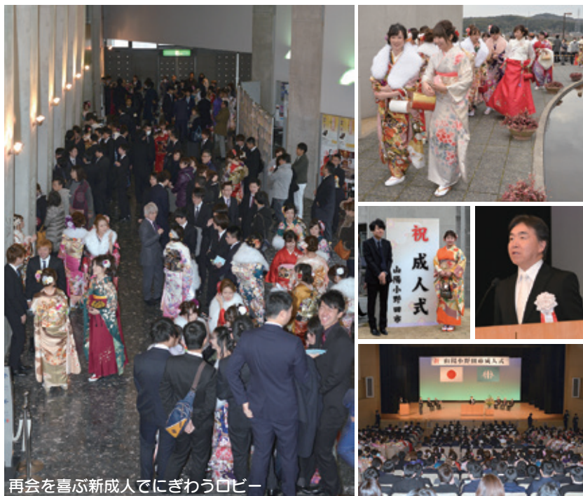
再会を喜ぶ新成人でにぎわうロビー