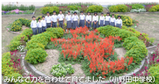
みんなで力を合わせて育てました (小野田中学校)

今年の夏は猛暑で、花が枯れないようにどの団体も水やりや、日よけなどに苦労されたそうです。その中でも、「たくさん日焼けをしたが、花の成長を見るのが喜びだった」「花があることで地域のみなさんが集まってくれるのがうれしい」「花が大好きで、毎年花壇づくりを楽しんでいる」など、それぞれが想いを込めて育てた結果、花いっぱいの美しい花壇になりました。秋空のもと、サルビア、マリーゴールド、ペチュニアなど色鮮やかな花が咲いた花壇を前に、受賞者のみなさんの笑顔が輝いていました。