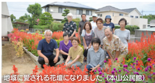
地域に愛される花壇になりました (本山公民館)