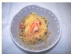
そうめん瓜なます