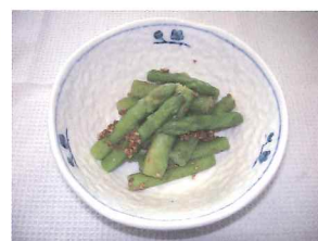
グリーンアスパラのごまあえ