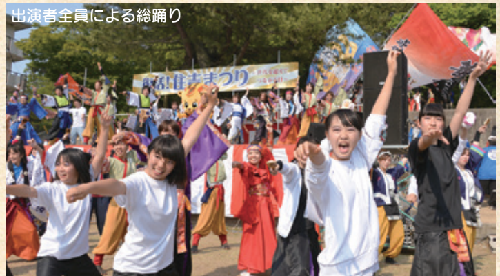
出演者全員による総踊り