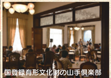
国登録有形文化財の山手倶楽部