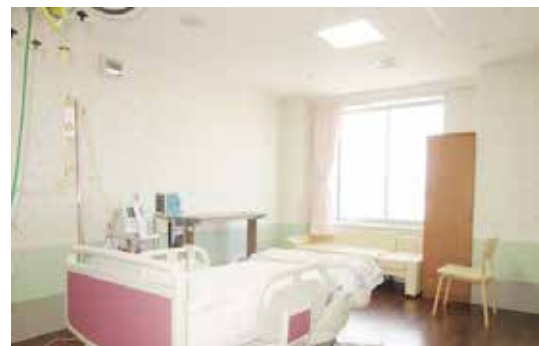
← 新病院の陣痛分娩室