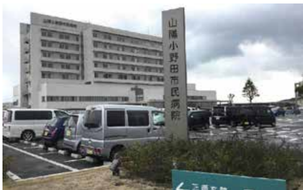
市民病院に平日夜間診療所を