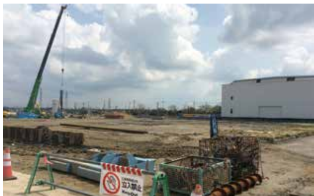
急ピッチで進む薬学部校舎建設

答 研究課題として4月中旬までに、29年度の入札のあり方について取り組んでいきたい。