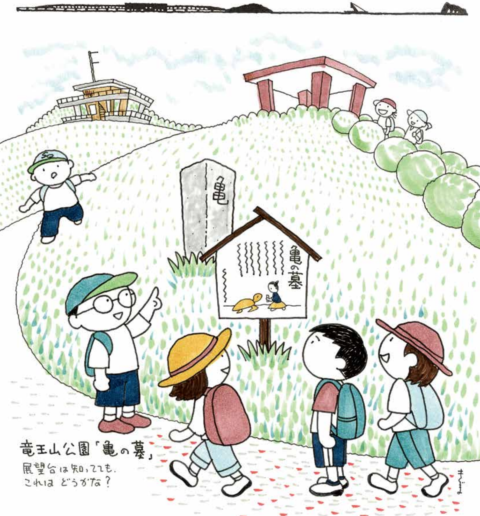
竜王山公園「亀の墓」 展望台は知ってるも、 これは どうかた?