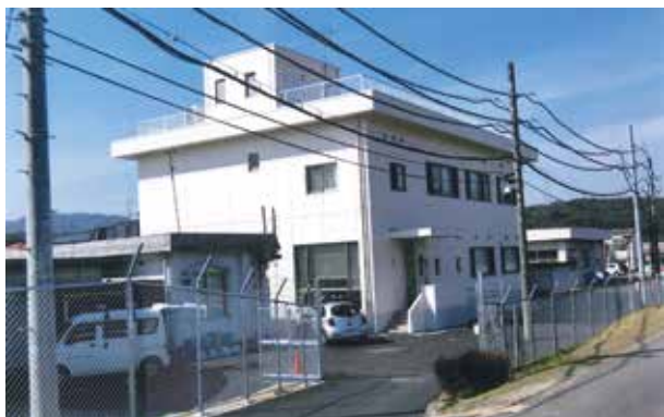
機能強化された鴨庄浄水場

答 コンビニ収納は高額な手数料の発生など多くのデメリットが判明し、当時は前向きな対応をとるに至らなかったが、要望は多く県内の自治体においても9市が導入し、一般的に定着している。本市においても使用者の利便性向上のため本年10月導入に向け鋭意進めている。