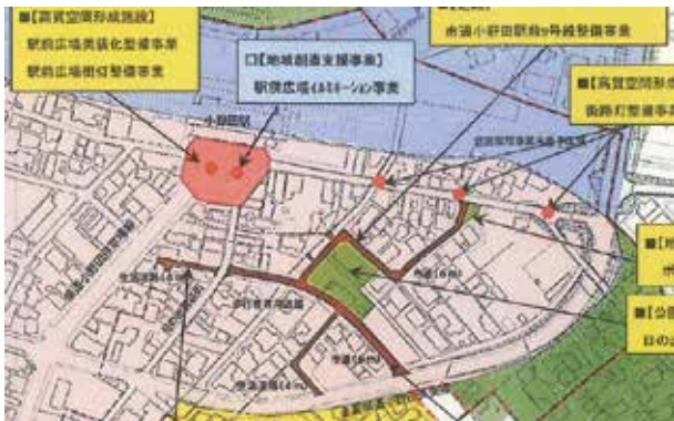
都市再生計画（小野田駅前）概要図

答 地域の住民活動や小学校運営での教育ネット事業が、非常に活発であり、ボランティアの参加が多いことも理解している。教育委員会としてもその支援をし、活性化に努力していく。また、児童数の減少は、本市の最大の問題だと認識している。解決手法を誤らないように全体として検討する。県道小野田美東線の道路改良は、有帆小そばの橋の改修を実施中だが、改良拡幅工事の計画はない。