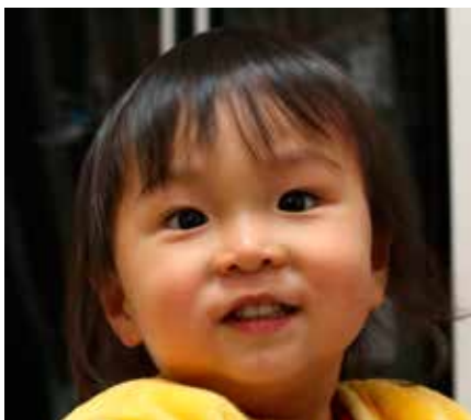
子どもの笑顔を守りたい

答 今後は、子育て応援のアピールを外向けにするのも大切だと思っているので、地域福祉計画等の中でもうたっていきたい。