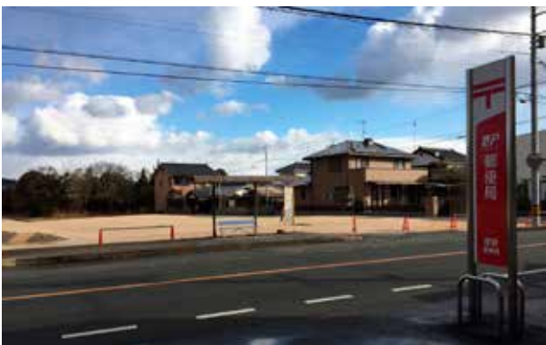
売却先が不明な厚狭公民館跡地

答 人道の出入口を広げることは困難であるが、防犯灯の設置や側溝舗装、鉄板歩道の改修など、より歩行しやすい通路として整備していく。