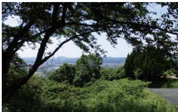
素晴らしい展望を失った物見山公園

答 物見山公園の維持管理はシルバー人材センターが行っているが、より適切な維持管理を行うためには協定内容・契約額の見直しに加え、別の予算措置の検討も必要と考える。地域で公園美化活動等を行うボランティア団体が発足し、近く活動を開始すると聞いており、市も管理体制の強化と適切な対応に努め、官民共助による公園管理のモデル地域にしたい。