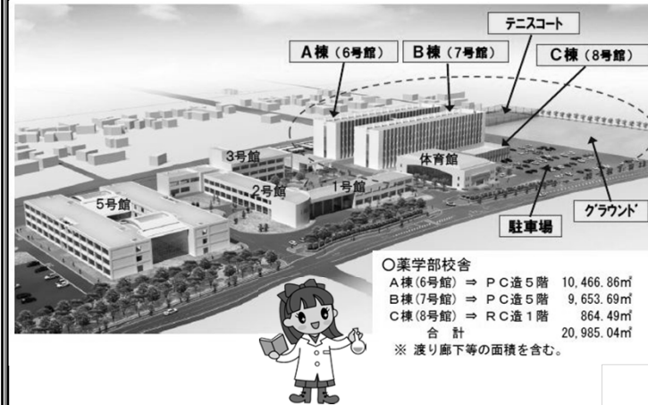
薬学部校舎完成予定図