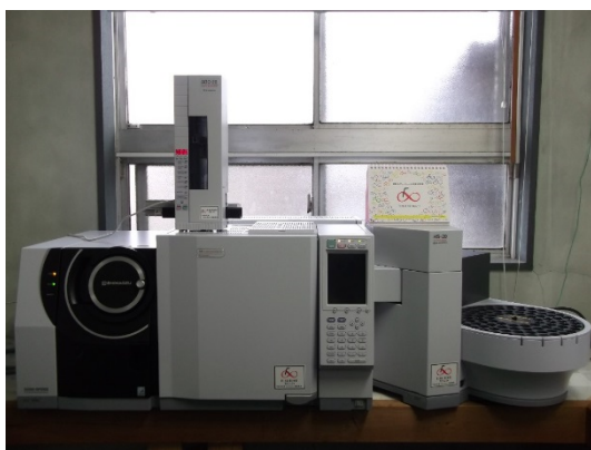
ガスクロマトグラフ質量分析計（平成28年度整備）

近年、生産から廃棄までの全工程において、環境に配慮、適合した製品が求められている中、これらの調査結果が企業内で生かされ、環境問題の解決につながる工業製品の品質向上、機械の改良に寄与しています。