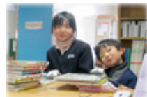
▲貸出作業を体験 ◀としょかんパスポート