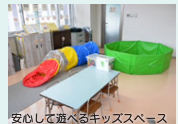
安心して遊べるキッズスペース