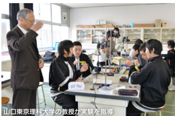
山口東京理科大学の教授が実験を指導

ほんものの科学体験講座が 1 月 24 日、赤崎小学校で行われ、松原分校の児童・生徒 11 人が「電気のおこし方と電気のはたらき」を学びました。手回し機械のハンドルを回しておこした電気で、プロペラが回ったり、LED ライトが発光したりする様子を大喜び。科学の魅力を実感しました。