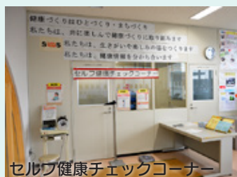
セルフ健康チェックコーナー