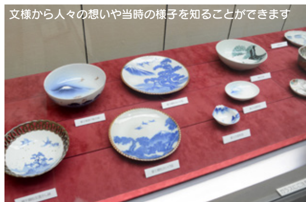
文様から人々の想いや当時の様子を知ることができます