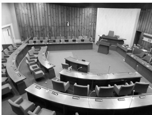
本会議場(市役所3階)