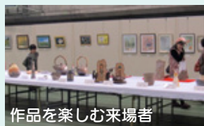
作品を楽しむ来場者

絵画, 書, 写真, 工芸作品など合計400点近くの作品が展示され, 来場者は多種多様な作品に感心しながら, 芸術の秋を堪能していました。