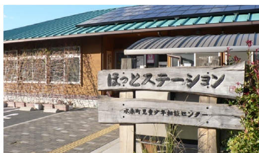
子どもや保護者の相談を受ける児童少年相談センターほっとステーション【福岡県水巻町】

議員 高齢者のインフルエンザ予防接種は10人に6人弱しか受けていない。この接種率を増やしてほしい。