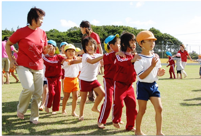
親子で元気に遊ぶ子どもたち

今や課題山積で市長一人では手に余る問題も多いので、しかるべき時機に同意案件を提出したいが、その時は詳しい資料を用意したい。