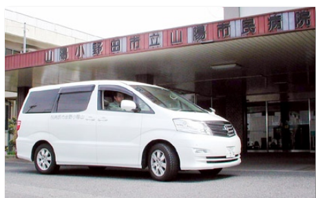
無料循環バスだけでは安心・安全は守られない

病院事業管理者 新病院の構想案では、ベッド数は300床を考えているが、山陽市民病院の跡地問題等々で延ばしていた。近々検討委員会を再開する必要があると思っている。