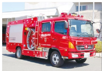
水槽付消防ポンプ自動車

て自己分団の消防車の取り扱いを熟知することが第一で、同様の消防車を使っての競技大会は考えていない。