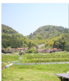
松嶽山に広がる中山間地