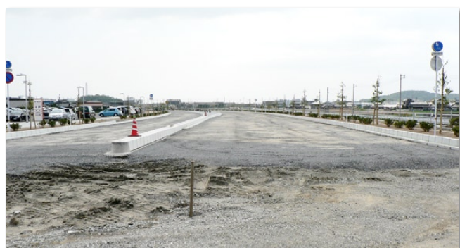
早期完成が待たれる「小野田湾岸道路」

議員 本市の道路整備はまだまだ不十分であり、地域間の交流と連携を進める山口宇部小野田連絡道路、あるいは国道や県道などの幹線道路、そして日常生活に密着した市道の整備、救急・消防等の安心安全の観点からの道路整備、また交通安全対策など、多くの市民が道路整備の推進のために、国・県への要望をしていただきたい。