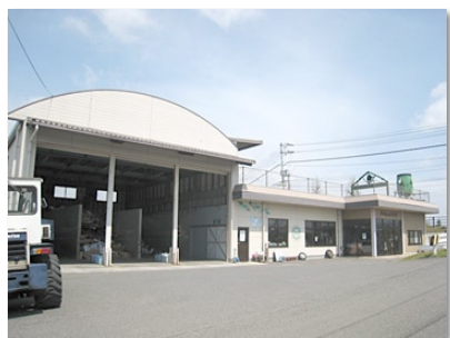
リサイクルセンターとタルちゃんプラザ