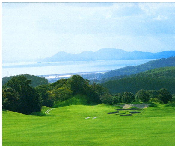
少年男子ゴルフ競技の開催地（山陽国際ゴルフクラブ）