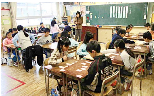
モジュール授業での1コマ

百マス計算の中において子どもは早く書こうと頭の回転より手の方が追いつかないことで字が汚くなる傾向にある。注意しているが今までの学習方法は、いろんな目的があつて一つの授業が成り立つ。授業の前にトレーニンングとしてモジュール授業を位置付けている。それは、目的を単体、一つのことにし