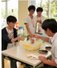
薬学に関する相談コーナー