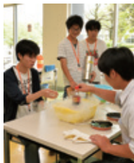
薬学に関する相談コーナー