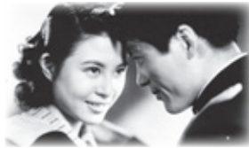
また逢う日まで のワンシーン

近代日本の光と影を情感豊かなりア リズムで描いた今井正監督の多彩な 作品の中から、2 作品を上映します。 この機会にぜひご鑑賞ください。