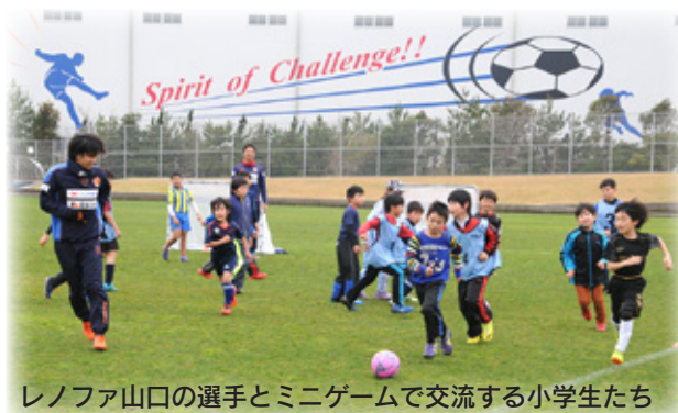
レノファ山口の選手とミニゲームで交流する小学生たち

『2020年東京オリンピック・パラリンピック』など、日本・世界の文化・スポーツの分野でおおいに活躍する市民が、一人でも多く現れることを願っています。夢は膨らみます。」