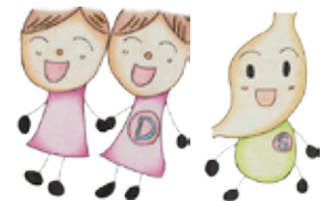
がん検診PRキャラクター 「にゅうちゃん」「いっちゃん」