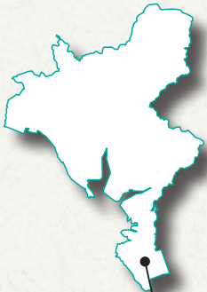
山口東京理科大学