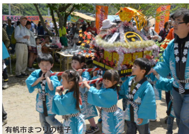
有帆市まつりの様子

早速、来春の県内就職先の開拓を、一部の担当部署に任せず、全学の協力のもと、私も一緒になって頑張りたいと考えています。