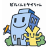
経済センサス キャラクター

6月1日現在で、全国一斉に「経済センサス - 活動調査」を実施します。この調査は、すべての経済センサス事業所・企業を対象に、売上金額・費用などの経理項目について調査するもので、調査結果は行政施策の立案や民間企業の経営計画策定など、重要な基礎資料として広く利用されます。5月中旬から調査員証を携行した調査員が伺いますので、ご協力ください。