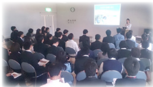
▲昨年度の説明会の様子