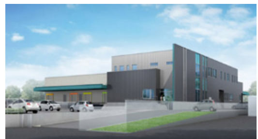
▲学校給食センター完成イメージ