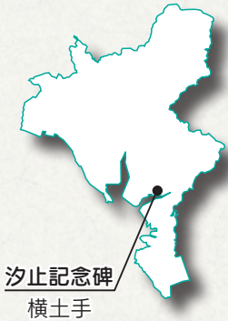
汐止記念碑 横土手