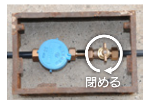
メーターボックス(左:メーター 右:止水栓)▲

メーターボックス内にある止水栓を閉め、水道局または水道局指定給水装置工事業者に連絡してください。