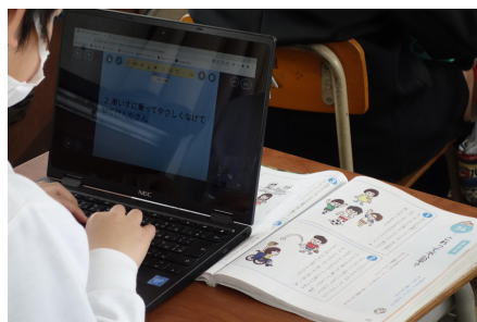
入力中の手元の様子