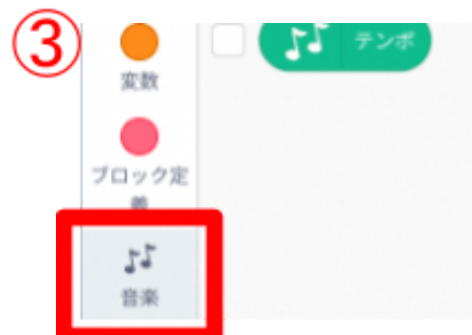
追加される「音楽」タブより利用できます