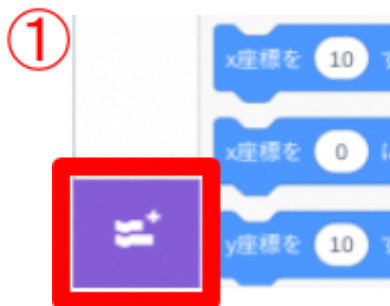
Scratch画面左下の「拡張機能を追加」をクリック

拡張機能を追加することで様々な楽器の音やリズムに沿った音を鳴らすことができます。