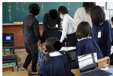
友達と話し合いを行う様子