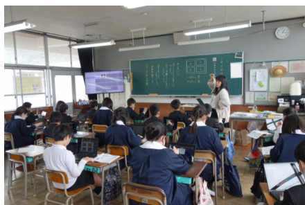
カードに考えを記入する様子

教科書の事例が公平だと思う場合は青いカードに、不公平だと思う場合は赤いカードにその理由を書き込みます。理由の中には、それは差別になるといったはっきりとしたものや、やさしさだから公平、思いにすれ違いがあるから不公平など意見が割れるものもありました。難しい問題に対して全員で向き合う姿がみられる授業でした。