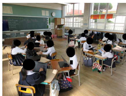
グループ内で意見交換