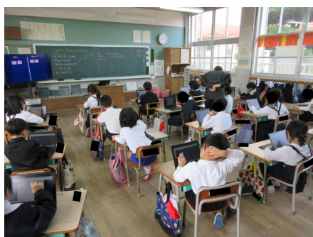
各自でカードを作成している様子

料理を作ってくれるや洗濯物を干してくれる、お風呂掃除をしてくれるなど、様々な意見がありました。グループでの意見交換の際も「そういえばこれがあった」といったやりとりがあり、Chromebookの画面を見せ合いながら授業が進められていました。