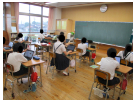
スライドの作成を行っている様子