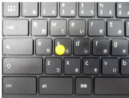
位置シールが貼ってある1年生の端末