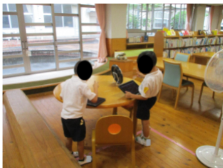
図書室から教室へGoogle Meet で接続

6年生はGoogleスライドで修学旅行に関連した資料を作成しています。（画像右）戦争や原爆とそれらに関わりのある人物について各々が調べ、5年生へ発表します。文字の色や大きさ、スライドのアニメーションなどを調整し、わかりやすい資料となるよう何度も先生のチェックを受け、試行錯誤が繰り返されていました。