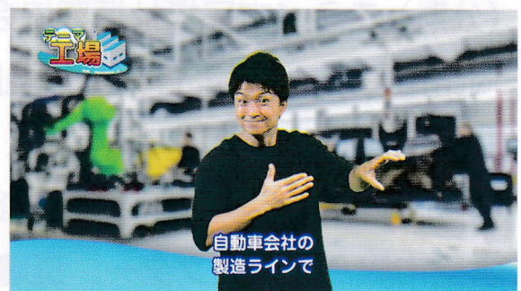
手話と字幕によるオリジナル番組