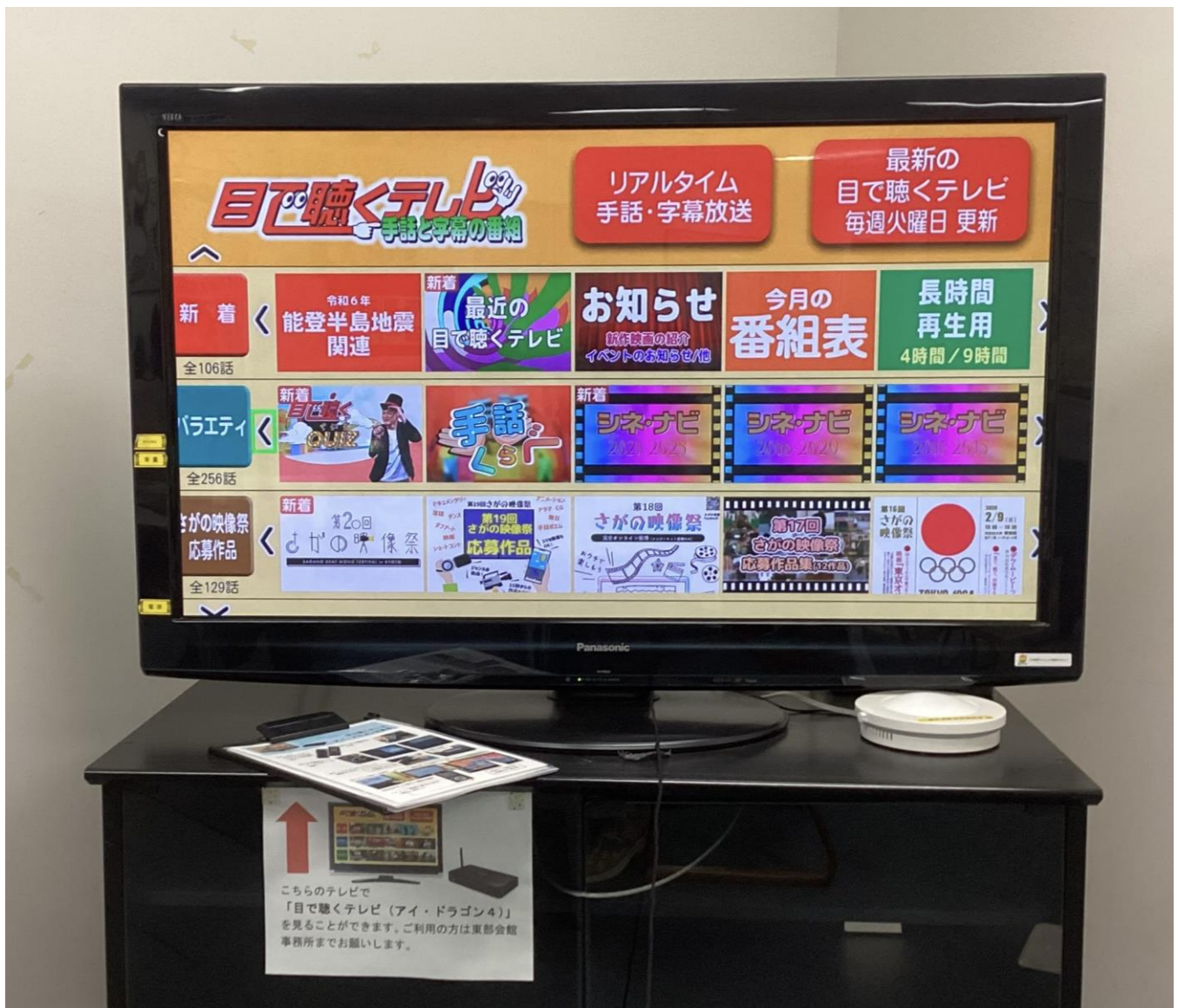
北九州市立東部障害者福祉会館に設置 の「アイ・ドラゴン4」