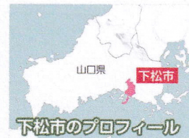
下松市のプロフィール