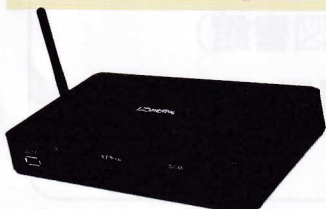
聴覚障害者用情報受信装置 「アイ・ドラゴン4」

認定特定非営利活動法人 障害者放送通信機構は、文化庁からリアルタイム字幕配信事業者の指定を受けています。