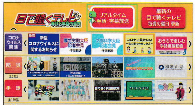
「目で聴くテレビ」トップ画面