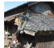
緊急代執行を要する 崩落しかけた屋根