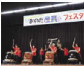
▲おのだ産業フェスタ2023で演奏する竜王太鼓保存会

Profile・山陽小野田市在住。仕事終わりに竜王太鼓保存会のメンバーで集まり、太鼓を叩くのがストレス発散方法。竜王太鼓保存会はメンバーを募集中。太鼓に興味がある人や龍王伝説に興味のある人も大歓迎です。ぜひ☎82-1115(文化スポーツ推進課)にお電話ください。