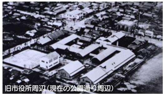
旧市役所周辺(現在の公園通り周辺)