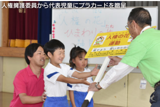
人権擁護委員から代表児童にプラカードを贈呈

津 布田小学校体育館で5月13日、「人権の花運動」種贈呈式が行われました。この運動は、花を育てることを通して協力することを学び、生命の尊さを実感する中で、人権尊重の考えを育むことを目的としています。みんなで育てて、大きな花を咲かせようね。