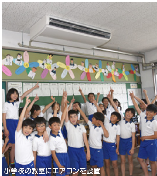
小学校の教室にエアコンを設置