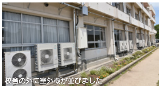
校舎の外に室外機が並びました