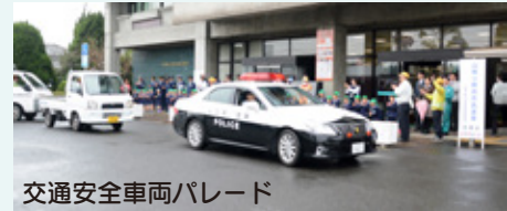
交通安全車両パレード