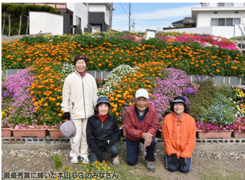
最優秀賞に輝いた本山GGのみなさん