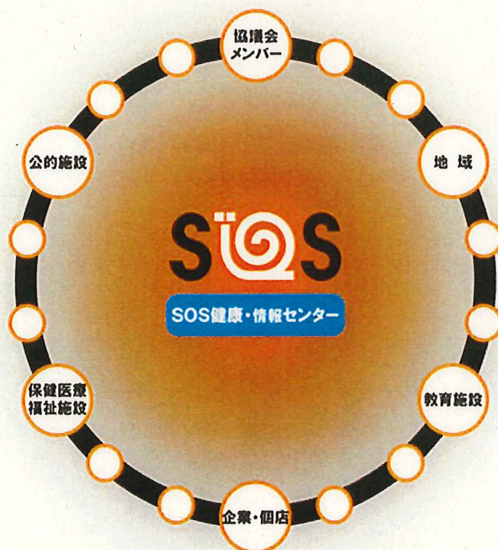
第1次計画における「ネットワーク概念図」

健康・情報センター*の認知度をあげる取組を行っていきます。また、健康・情報センター*の活用について、検討していきます。