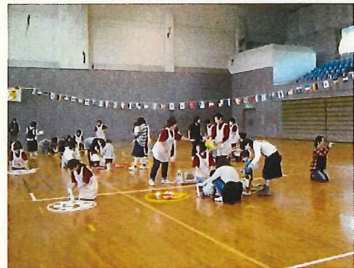
母子保健推進協議会による 三二運動会