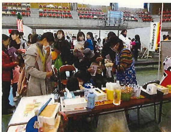
SOS健康フェスタでの歯科衛生士会による フッ素塗布の実施