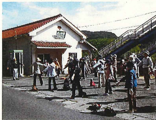
健康推進員地区活動（ウォーキング）