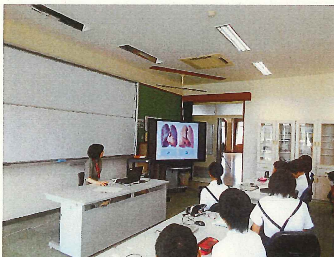
小学校での健康教育