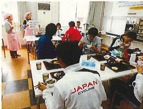
食生活改善推進協議会による 減塩プロジェクト