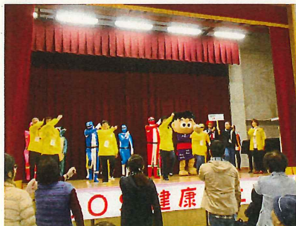
SOS健康フェスタでの SOSおきよう体操の実施