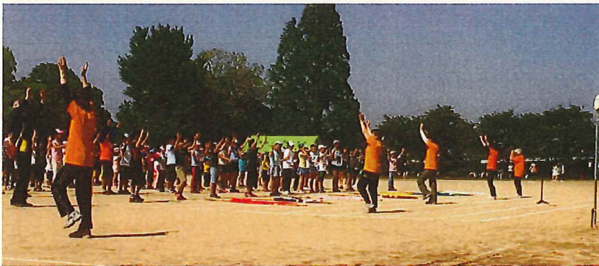
市民運動会でのSOSおきよう体操の実施